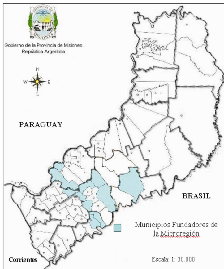
Figura 1: Municipios que comprenden la Microregión Misiones al 2002